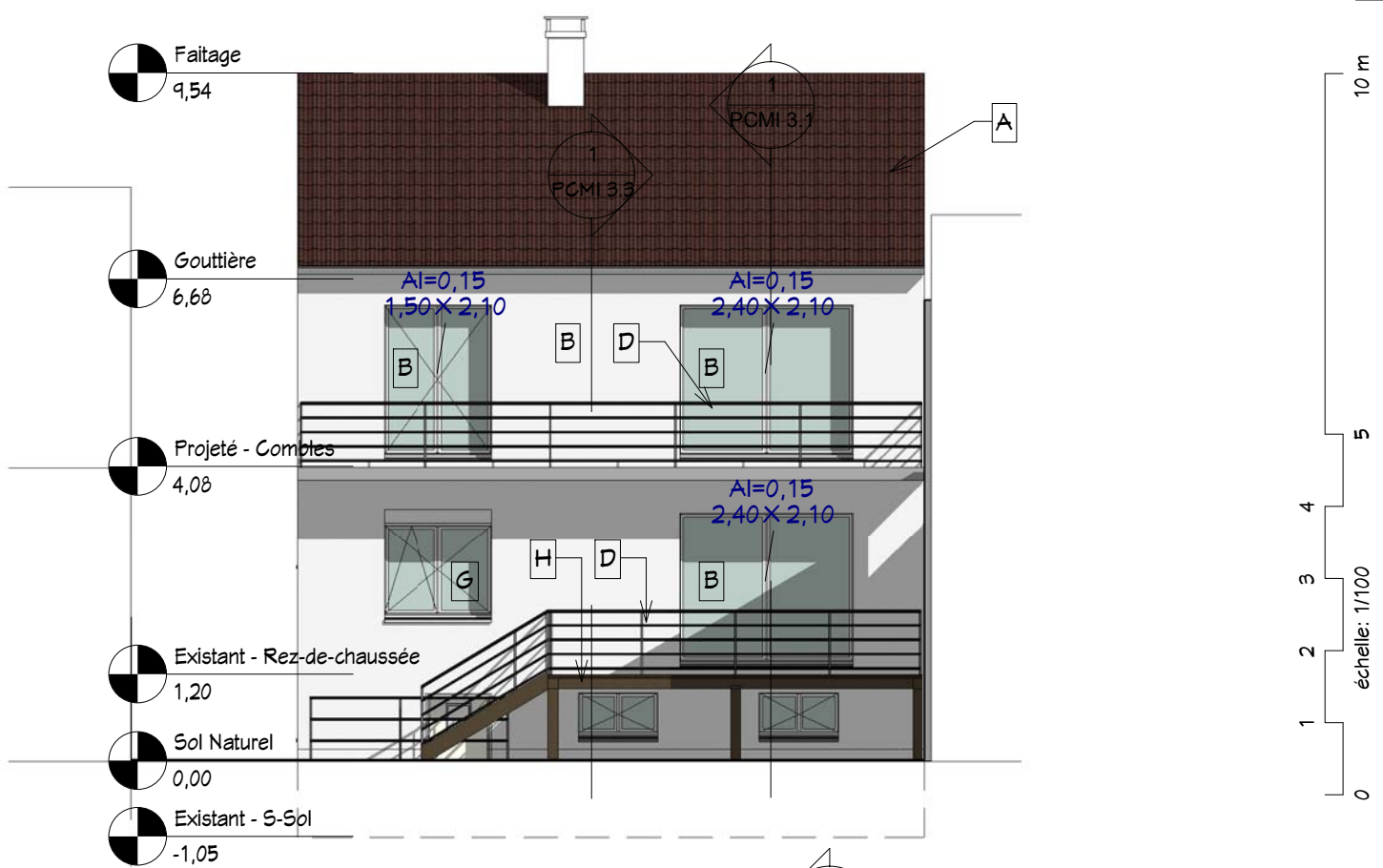
2 Projeté - Façade Sud 1 : 100